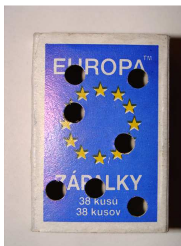
Obr.2: Dierkovačom perforovaná krabička zabezpečuje, aby vzorka neporástla plesňami. Pred predierkovaním vrchnáka vyberte vysúvaciu časť, aby ostala neporušená.

Ak je vzorka príliš vlhká, je možné ju nechať v otvorenej škatuľke čiastočne presušiť pri izbovej teplote počas 12-24 hodín. Vzorky nesušte na radiatore !!!! Pri balení vzoriek pred odoslaním používajte len priedušné materiály (papier, papierové krabice). Nevkladajte vzorky do igelitových vreciek a obalov, nakoľko takto zabalené vzorky plesnivejú a skresľujú výsledky získané z Vašich vzoriek !!! Vzorky balené do nepriedušných igelitových obalov nebudú vyšetrené.