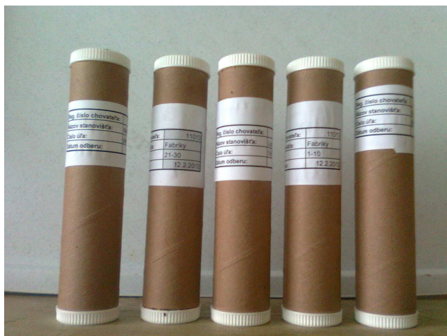
Obr 3: Správne označené vzorky.

Zmesné vzorky po odbere odovzdajú chovatelia na regionálnej veterinárnej a potravinovej správe. Táto zabezpečí vypísanie sprievodného dokladu a odošle vzorky do národného referenčného laboratória v Dolnom Kubíne alebo veterinárnych a potravinových ústavov Bratislava a Košice.